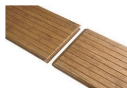
Nut + Feder zur Endlosverlegung