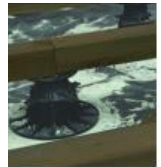
Abbildung 2: Bodenträger (3)