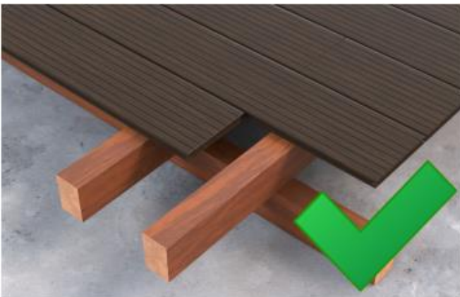
Abbildung 3: Doppelte Unterkonstruktion mit doppeltem Bodenbalken an den Enden